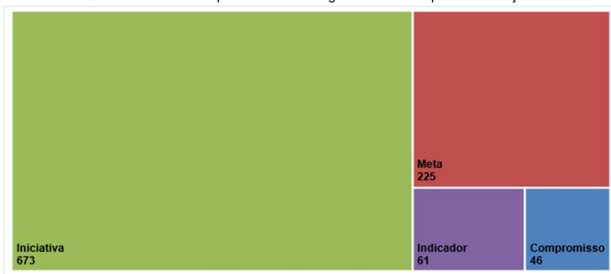
Gráfico 1 – Quantidade dos Componentes dos Programas do Escopo da Avaliação de Desenho

Por fim, um último insumo compreende os elementos do Desenho Lógico, identificados a partir dos componentes dos sete Programas do PPA 2020-2023 integrantes do escopo da Avaliação de Desenho. Isso resultou na análise de 1.005 componentes dos respectivos Programas, além das Contextualizações, cujo detalhamento está no Gráfico 1. O Quadro 4 apresenta as correlações entre esses elementos do DLP e os componentes dos PPA.